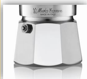
Valvola ispezionabile brevettata Bialetti