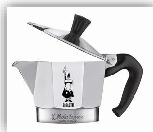
Realizzata in alluminio, con manico ergonomico